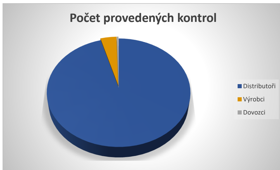
Graf č. 1: Počet provedených kontrol u jednotlivých zodpovědných osob

Státní zdravotní dozor v 2. pololetí 2024 byl prováděn dle kontrolního plánu pro rok 2024, s ohledem na přijaté podněty spotřebitelů a ostatních dozorových orgánů. V rámci kontrolní činnosti bylo během 30 nevyhovujících kontrol nalezeno 91 nevyhovujících výrobků u kterých se jednalo zejména o pochybení ve značení.