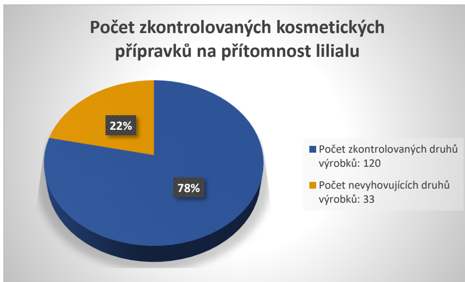
Graf č. 2: Počet zkontrolovaných kosmetických přípravků na přítomnost lilialu

Oddělení PBU Krajské hygienické stanice Jihomoravského kraje se sídlem v Brně pokračovalo v období od 01. 07. 2023 do 31. 12. 2023 v kontrolách provozoven, ve kterých jsou zákazníkům nabízeny kosmetické přípravky. Kontroly byly zaměřeny na výskyt zakázané látky lilial (butylphenyl methylpropional) obsažené ve složení výrobků. Z celkového počtu 53 kontrol bylo 11 kontrol nevyhovujících , kdy bylo zkontrolováno celkem 120 druhů kosmetických přípravků. Za zjištěné nedostatky byla uložena nápravná opatření vedoucí k odstranění závad a uloženy sankce ve výši 14 000 Kč .