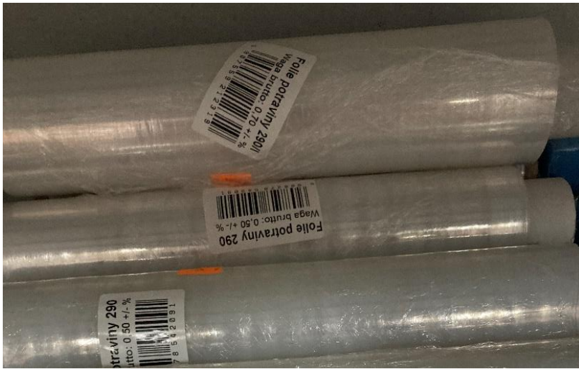
Obrázek 2. Příklad nevyhovujícího značení výrobku určeného pro styk s potravinami

Zjištěná pochybení byla řešena stažením výrobků z prodeje, doznačením a postoupením místně příslušné Krajské hygienické stanici. Kontrolovaným osobám byla za zjištěná pochybení udělena sankce v celkové výši 15000,- Kč.